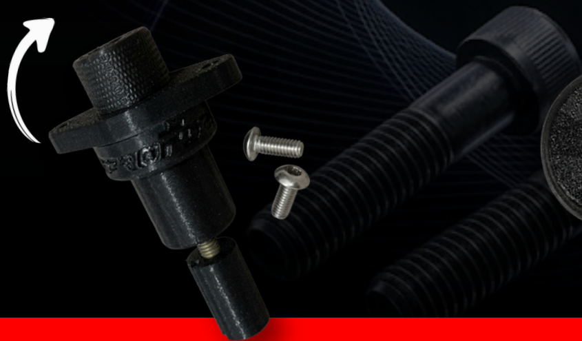
Regulador marcha lenta tbi